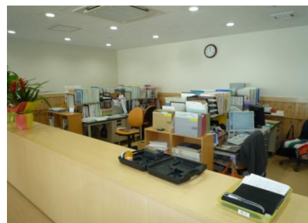
真寿苑ケアプランセンター