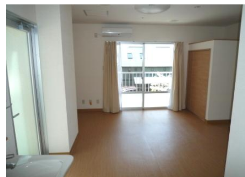
居室 A タイプ