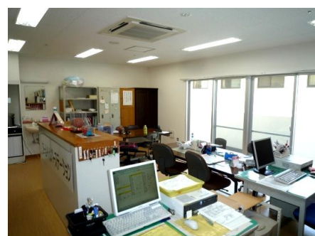
真寿苑ホームヘルプサービス