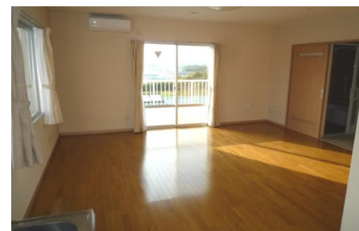
居室 B タイプ