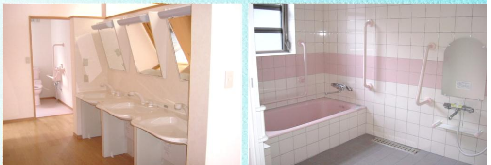
暮らしやすさを考えたユニバーサルデザイン