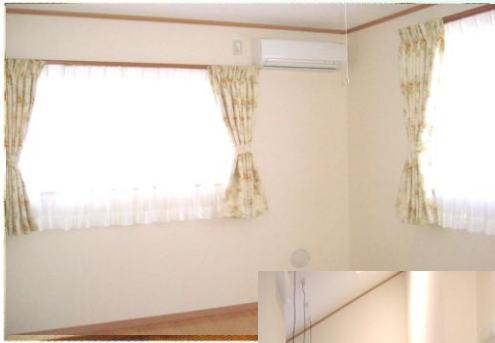
全室個室 続き部屋もあります