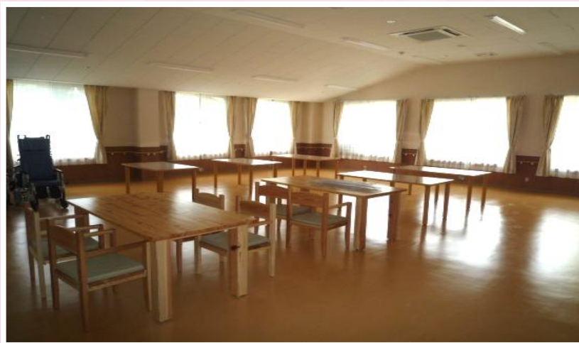
使いやすいさを考えた紀州木材の机と椅子 食堂・リハビリ室