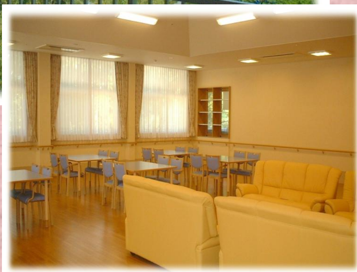
デイサービスセンター